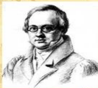
Антон Антонович Дельвиг