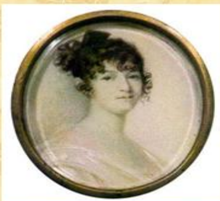
Н.О. Пушкина. 1800-е гг.

Отец, Сергей Львович , небогатый помещик, человек образованный, хорошо знал литературу, был знаком со многими русскими писателями и сам немного писал.