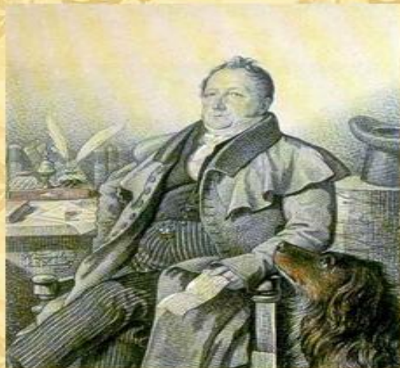
С.А. Пушкин. 1824.