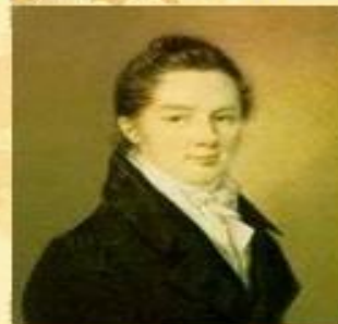
Иван Иванович Пуцин

Пушкин сохранил лицейскую дружбу и культ Лицея на всю жизнь.