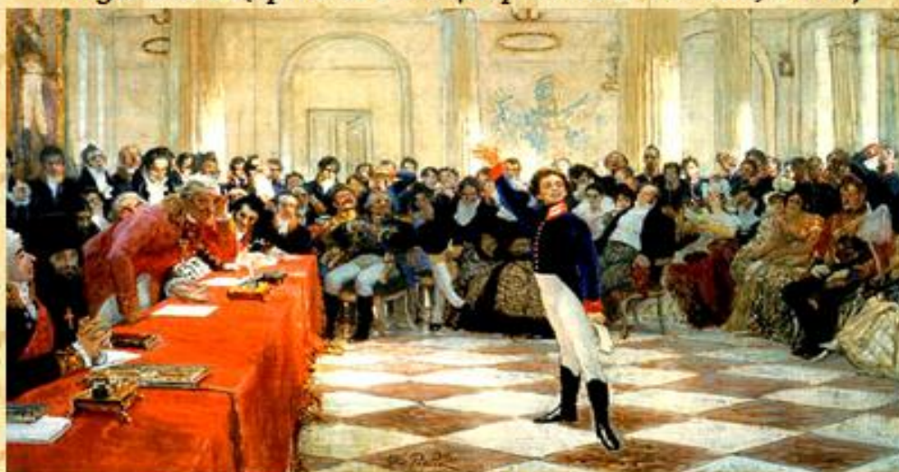
"Пушкин в Царском Селе". (Картина И. Репина, 1911.)

В 1815 г. Пушкин с триумфом прочел на экзамене свое стихотворение "Воспоминание в Царском Селе" в присутствии знаменитого поэта Г.Р.Державина. Срок пребывания в лицее кончился летом 1817 года. 9 июня состоялись выпускные экзамены.